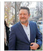
Gobierno regional suscribió contrato con fundación investigada.

REFORMA AL SISTEMA DE NOMBRAMIENTOS INGRESA HOY: MINISTERIO DE JUSTICIA PROpondrá CONSEJO PERMANENTE DE CINCO MIEMBROS Y MANTENER LOS CUPOS DE SUPREMOS "EXTERNOS" | C 2