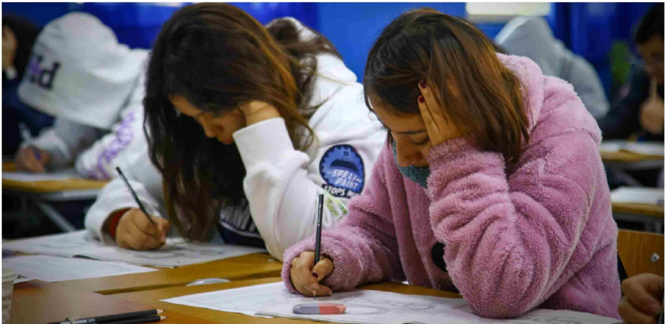
► La frustración por no alcanzar un objetivo puede generar tristeza, enojo e incluso afectar la percepción personal.