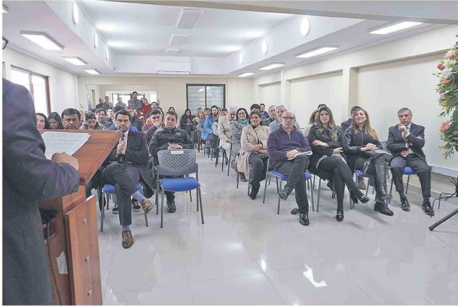
Senador Juan Luis Castro.