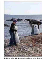
Más de 9 toneladas de basura fueron retiradas desde Chañaral de Aceituno, en Atacama, caleta de interés turístico por ser una de las principales fuentes de avistamiento de ballenas del país. | C 10

NIVEL DE RECURSOS FISCALES DESTINADOS A ESTE ÁMBITO NO PODRÍA REPLICARSE EL PRÓXIMO AÑO | B 2