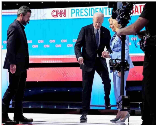
En el que ha sido considerado un lapidario plano final del debate del jueves, se vio a la primera dama, Jill Biden, ayudando al mandatario, quien tenía dificultades para bajar las pequeñas escaleras del escenario e ir a despedirse de los moderadores. Se cree que la esposa de Biden es una de las personas que lo podrían convencer de dar un paso al costado, aunque ha reaccionado enérgicamente en el pasado contra los llamados para que lo haga.

EDITORIAL: "BIDEN-TRUMP: DEBATE INQUIETANTE" | A 3