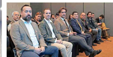
La iniciativa ha establecido un modelo de gobernanza regional participativo entre la academia, privados, sector público y representantes de la sociedad civil.