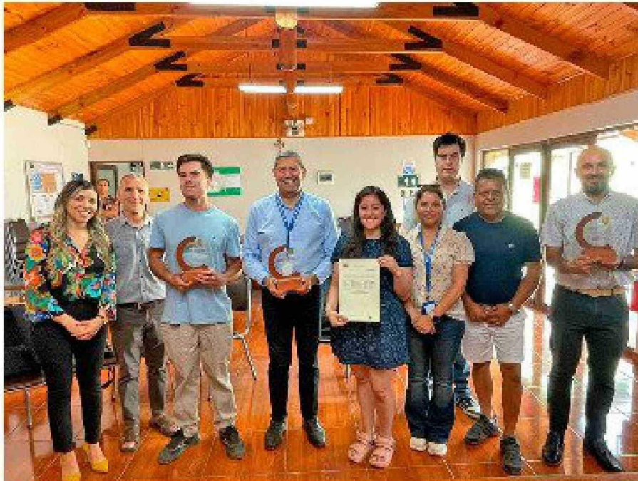
Esta semana se constituyó la Cámara de Comercio, Servicios, Industria y Turismo de Quinta de Tilcoco.