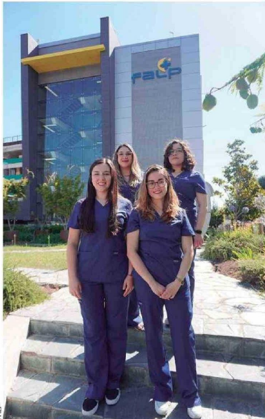
El equipo del Programa Oncoguía.