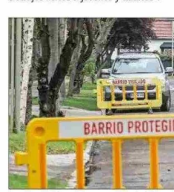
Las medidas de seguridad deben involucrar un esfuerzo mancomunado entre diversas instituciones, plantean especialistas.

Por ello, puntualiza que "un elemento importante sería crear oferta pública de desahucios, rehabilitación y tratamiento de adicciones para poder sacar a jóvenes adictos de la causa de violencia o de sus actos delictuales".