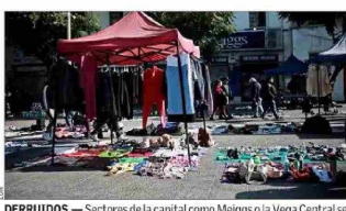
DERRUIDOS.— Sectores de la capital como Meiggs o la Vega Central se han deteriorado de la mano de la actividad informal.

Con distintos tipos de medidas, que van desde equipos de fiscalización hasta el aumento de permisos municipales, algunas autoridades han buscado enfrentar el fenómeno del comercio ambulante, que prolifera en barrios comerciales de las distintas ciudades.