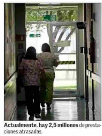
Actualmente, hay 2,5 millones de prestaciones atrasadas.

Otra propuesta, indica Sánchez, es "flexibilizar en forma inteligente la gestión médica para incentivar el trabajo fuera de horarios normales, sujeto a normas e incentivos claros y bien gestionados y supervisados para evitar el abuso", y "resignar más recursos a establecimientos que claramente lo requieren, pero amarrados a cumplimiento de indicadores y metas, sancionando el incumplimiento".