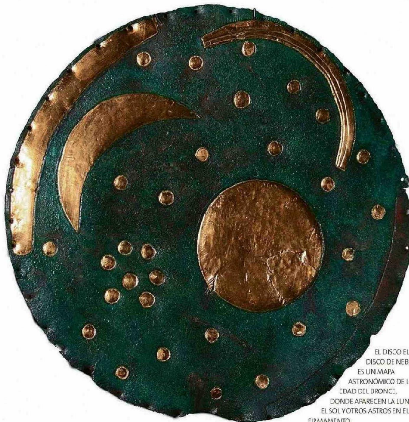
EL DISCO EL DISCO DE NEBRA ES UN MAPA ASTRONÓMICO DE LA EDAD DEL BRONCE, DONDE APARECEN LA LUNA, EL SOL Y OTROS ASTROS EN EL FIRMAMENTO.