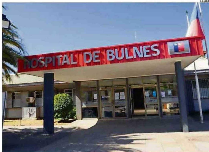
HOSPITAL DE BULNES SERÁ UNO DE LOS ESTABLECIMIENTOS QUE SE BUSCA RENOVAR.

"estos estudios son los análisis básicos que tenemos que conocer para definir el modelo de gestión, los terrenos y la ubicación donde van a quedar emplazados los hospitales. El financiamiento ha sido aprobado de manera unánime, con eso estamos llevando justicia y