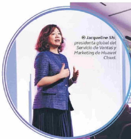
© Jacqueline Shi, presidenta global del Servicio de Ventas y Marketing de Huawei Cloud.