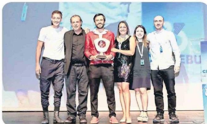
El certamen reúne año a año a diversas personalidades nacionales e internacionales del cine en Lebu y Concepción.

que incluirá la presencia de destacados invitados y momentos inolvidables para compartir", señaló Pino.