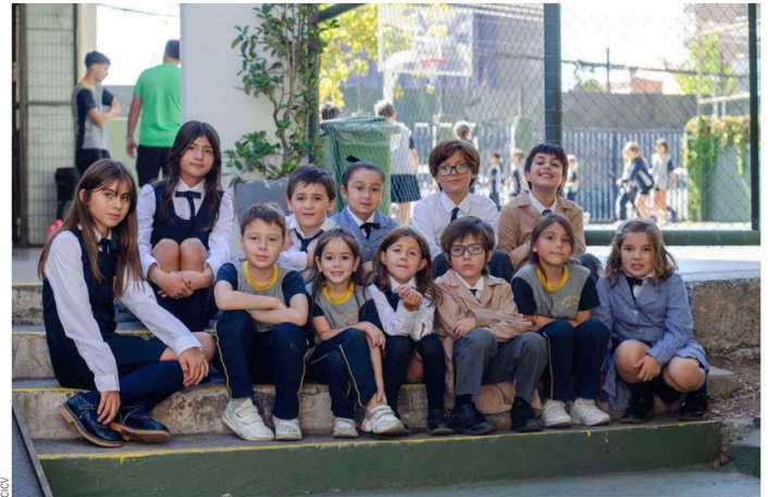
En el área académica, han incorporado innovaciones tanto en educación básica como media, utilizando metodologías complementarias de apoyo, tales como la diferenciación y el aprendizaje basado en proyectos.

como la diferenciación y el aprendizaje basado en proyectos (ABP). Esta última tiene como finalidad apoyar en la