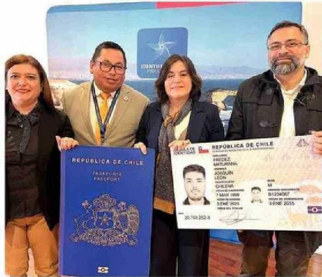
AUTORIDADES HICIERON LA PRESENTACIÓN DEL SISTEMA.

Además, indicó que estas renovación incluye un data center, nuevos mobiliarios e instrumentos tecnológicos, mejoramiento de conexiones de redes eléctricas y de comunicaciones en oficinas.