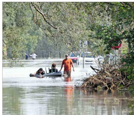
UNA DE LAS CONSECUENCIAS más dañinas son las inundaciones. En la foto, Tampa, que parece haber sufrido menos daños de lo esperado.

El Presidente estadounidense, Joe Biden, dijo que las medidas que se implementaron para salvar vidas "marcaron la diferencia", pero advirtió que todavía es pronto para evaluar el daño total causado por el huracán.