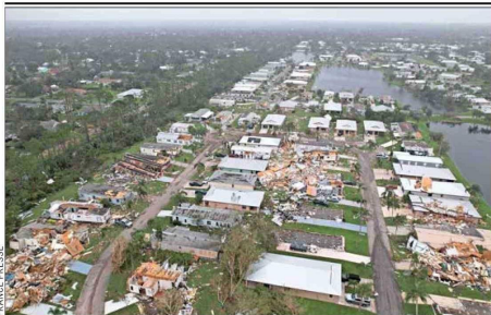
DEBIDO A LOS DAÑOS , al menos 3 millones de usuarios estaban sin luz. En la foto, las inundaciones en Fort Pierce.