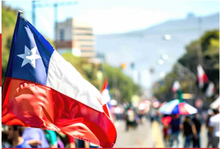
Chile en el ranking mundial y latinoamericano

En el contexto global de 30 países encuestados, Chile alcanza el puesto 11 a nivel mundial, y mejora notablemente su posición regional al ubicarse entre los países más felices de América Latina. No obstante, el estudio también destaca que los problemas económicos siguen siendo la principal fuente de infelicidad para los chilenos, reflejando desafíos pendientes en materia de bienestar.