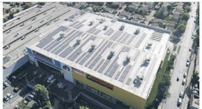
El evento de capacitación ofrecerá un nuevo curso dictado por Inacap sobre sistemas fotovoltaicos, tecnología que contribuye a abastecer 49 tiendas Sodimac desde Arica a Puerto Montt.

En 2023, se impartieron más de 190 mil capacitaciones en la Gran FERIA. Las inscripciones para los cursos gratuitos y detalles de la programación 2024 están disponibles en www.lagranferiadecapacitacion.com .