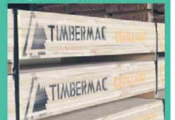
Entre los artículos sostenibles que se exhibirán en el encuentro, destaca la madera marca propia de Sodimac.

décima edición de la Gran FERIA de Capacitación es la presencia de RedMaestra, comunidad de mujeres técnico-profesionales que provee mano de obra calificada a la industria de la construcción. La organización estará entregando sus conocimientos para profesionalizar el negocio independiente.