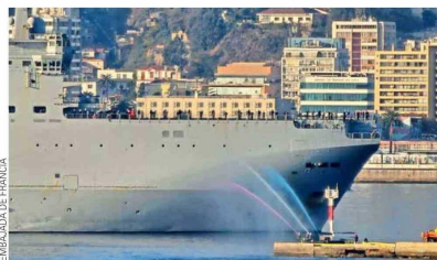
Recalada del "Jeanne d'Arc" en el puerto de Valparaíso.

de los cuales 674 eran extranjeros de 60 países, la Marina francesa también ha cambiado su filosofía. La Marine Nationale ya no despliega un buque escuela, sino un grupo anfibio que embarca a la escuela. Desde entonces, este grupo se utiliza también con fines operativos y ofrece la oportunidad de participar en operaciones reales.