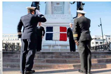
Visita al monumento a los Héroes de Iquique en Valparaíso.

Con la retirada del servicio del portahelicópteros Jeanne d'Arc en 2010 después de 45 años de haber formado a 6.300 guardiamarinas,