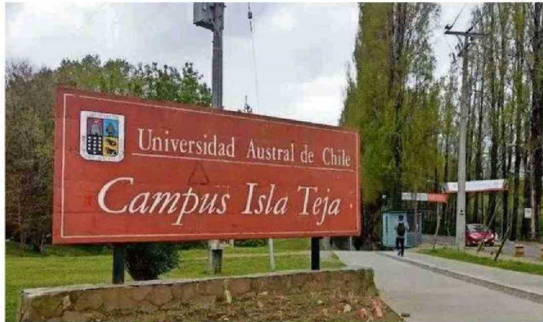
LA CASA DE ESTUDIOS ENFRENTA CRISIS FINANCIERA, LA CUAL ESTA SIENDO ABORDADA JUNTO A LA SES.