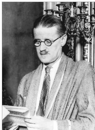
James Joyce publicó "Ulises" en 1922.

Hesse, o "Kristin Lavransdatter", de Sigrid Undset. Y otros títulos, sin ser los más conocidos de sus respectivos autores, los ubicaban también en ese año: W. B. Yeats, Virginia Woolf, William Faulkner, Marcel Proust, Fernando Pessoa, Federico García Lorca... En total, 18 obras (novelas, cuentos, poesía, memorias, teatro) y autores.