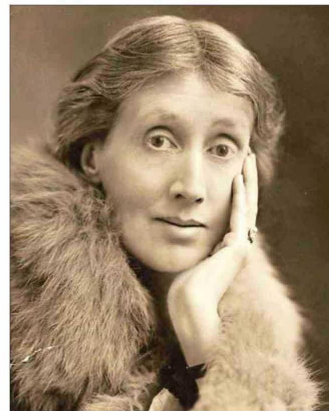
De Virginia Woolf es "El cuarto de Jacob".

dora introducción sobre su autor y el contexto en que fueron escritas. Así, con "el asombro de recibir y recorrer esas pági-