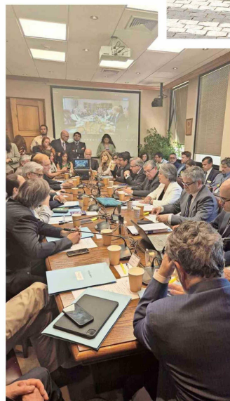
La expectativa en la comisión de Trabajo era tal, que se repleto la sala.