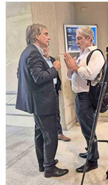
El senador Luciano Cruz-Coke conversó con el exsenador PS Juan Pablo Letelier antes de entrar a la comisión de Trabajo.