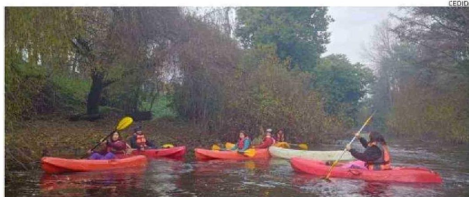
LOS PLÁSTICOS ESTÁN SIEMPRE PRESENTES ENTRE LOS DESECHOS SACADOS DE LOS RÍOS.

“Cuando nosotros hacemos reforestación, la hacemos a la orilla de ríos y ahí nos encontramos siempre con una importante cantidad de basura, tanto orgánica como inorgánica. Claramente, nosotros en algún momento entramos en contacto con la municipalidad para que toda esa basura que se recoge sea retirada con un debido proceso de elimina-