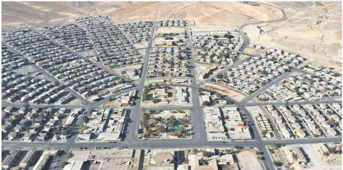
EL ASENTAMIENTO MINERO DE EL SALVADOR ES EL ORIGEN DE UNA MILLONARIA DISPUTA DONDE PROFESORES ALEGAN EL NO PAGO DE UNA ASIGNACIÓN POR 27 AÑOS.