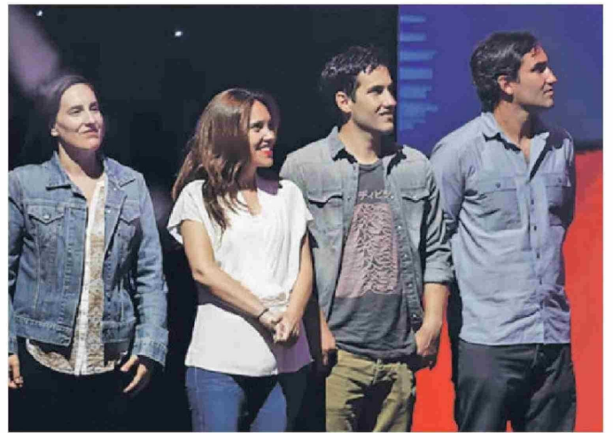
Los herederos del expresidente Sebastián Piñera.