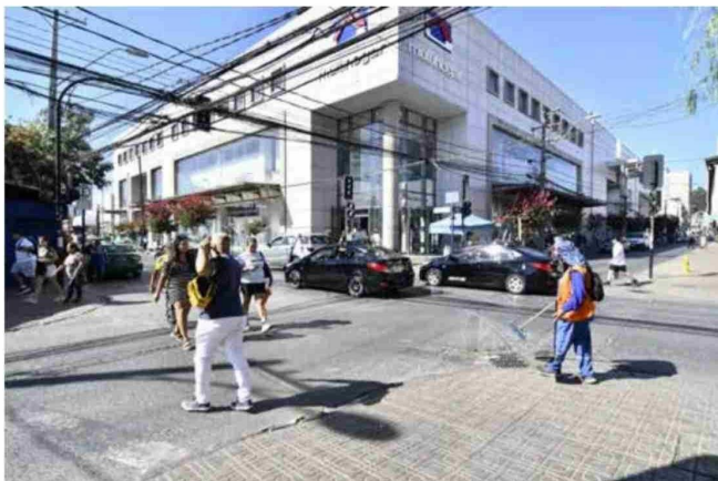
Las personas comenzaron temprano el retorno a sus hogares.