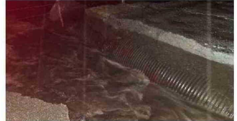
CAMINO RURAL COLAPSO DEJANDO AL DESCUBIERTO ALCANTARILLA.

El frente también generó el corte de camino en el sector cruce Montemar Alto hacia Montemar El Valle debido a desprendimiento de material, dejando al descubierto