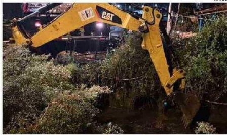
MAQUINARIA TRABAJANDO EN EL ESTERO SANGRA.

Carolina Larenas Faúndez carolina.larenas@laestrellachiloé.cl