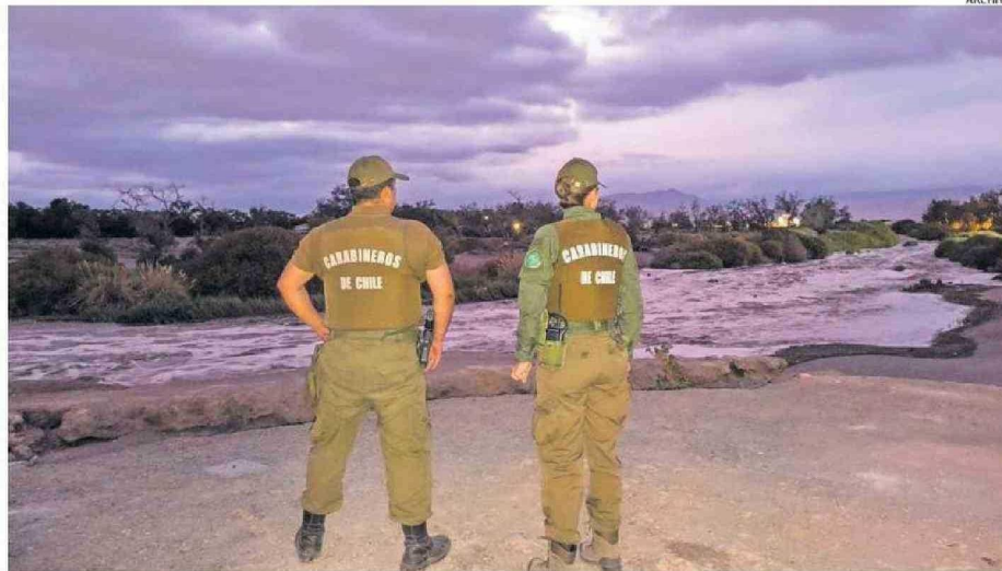
MONITOREO PERMANENTE POR CONDICIONES METEOROLÓGICAS PRODUCTO DEL INVIERNO ALTIPLÁNICO QUE AFECTA A LA PROVINCIA EL LOA.

En la actualización de la Alerta Temprana Preventiva para la provincia El Loa y las comunas de Antofagasta, Sierra Gorda, María Elena y Taltal por el evento meteorológico reportado desde hace varias