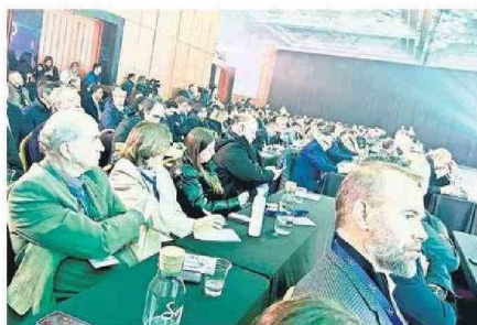
ALREDEDOR DE 400 ASISTENTES LLEGARON A LA ACTIVIDAD DE CPC.

de vanguardia como el de tierras raras en Penco con potencial de generar 2.600 empleos nuevos con un foco claro en electromovilidad, innovación y nuevas