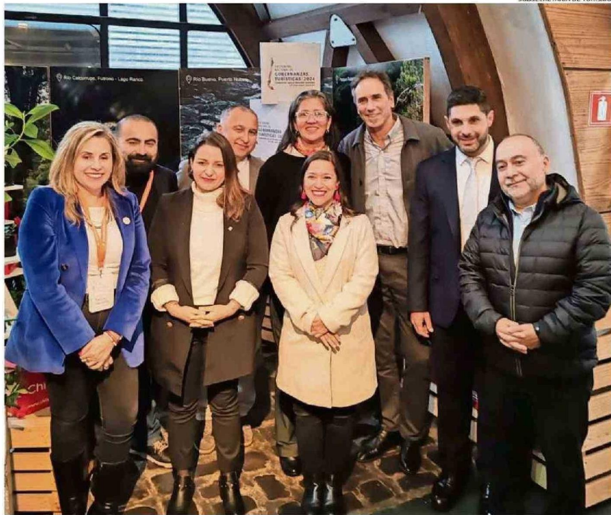
AUTORIDADES REGIONALES Y COMUNALES PARTICIPARON EN EL ENCUENTRO NACIONAL DE GOBERNANZAS QUE FUE LIDERADO POR LA SUBSECRETARIA.

Precisó que se trata de la ruta Ríos, Lagos y Volcanes. "Son parte del corazón de la oferta cuando hacemos promoción internacional. Y sabemos que también es muy relevante para la región la promoción que se haga con Argentina, y también