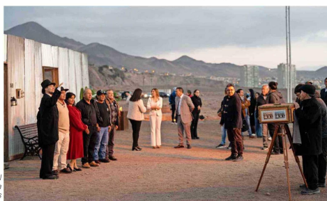
Los asistentes al lanzamiento del libro pudieron vivir la experiencia pampa, en el anfiteatro de Las Ruinas de Huanchaca.