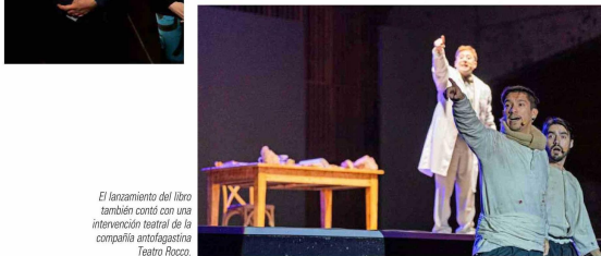
El lanzamiento del libro también contó con una intervención teatral de la compañía antofagastina Teatro Pozco.