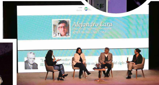
Participantes del conversatorio "Legado innovador: el doctor Stanley Freed y su impacto en la minería del siglo XXI".