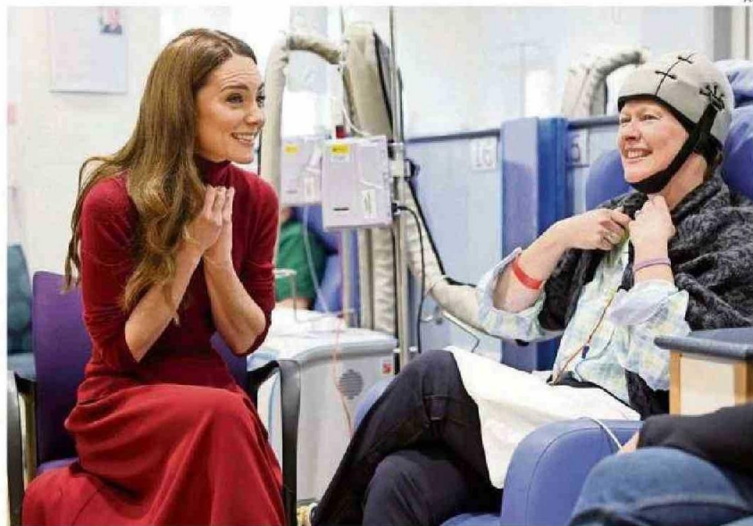
LA PRINCESA COMPARTIÓ CON LOS PACIENTES DEL HOSPITAL ROYAL MARDSEN.

La esposa del príncipe William aseguró que “era agrada-