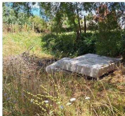
ES FÁCIL ENCONTRAR COLCHONES U OTROS RESIDUOS.