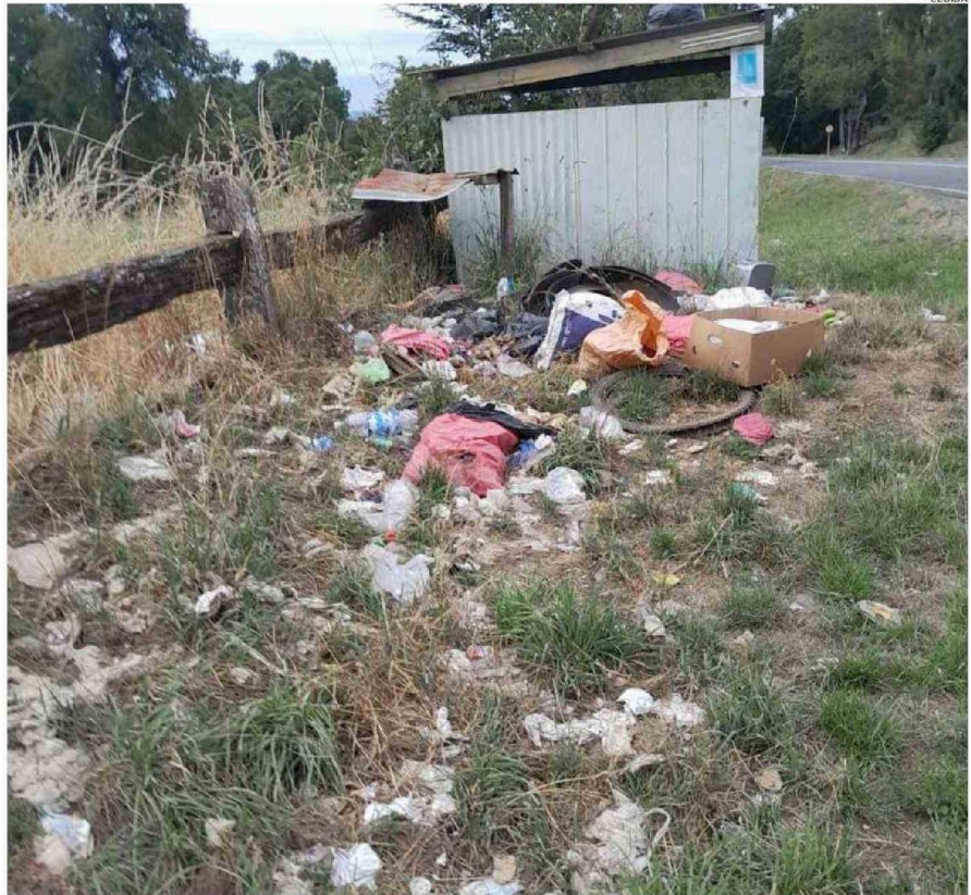
LOS MICROBASURALES ESTÁN VISIBLES EN ZONAS RURALES, CERCA DE RUTAS DE ALTO TRÁNSITO O, INCLUSO, DE ESTABLECIMIENTOS EDUCACIONALES.