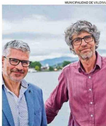
ORQUESTA DE CÁMARA DE VALDIVIA GANÓ EN CULTURA.