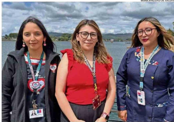
ESCUELA HOSPITALARIA DE VALDIVIA FUE ELEGIDA EN EL ÁREA DE LA EDUCACIÓN