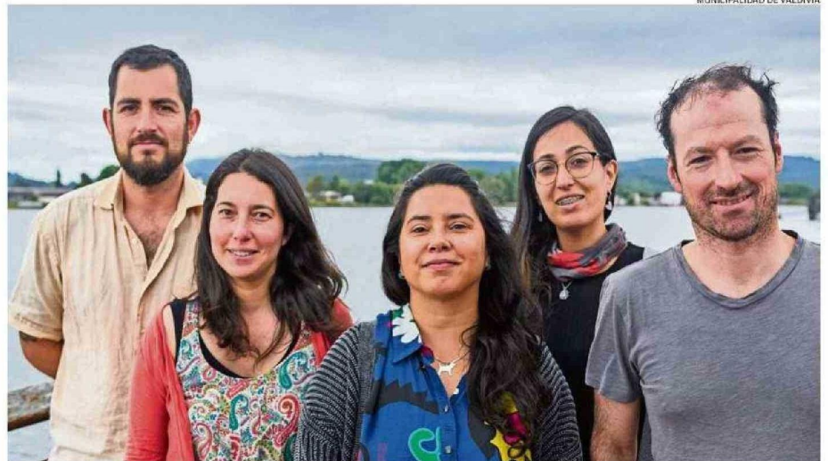
COMITÉ ECOLÓGICO LEMU LAHUEN FUE ELEGIDO EN LA CATEGORÍA “INICIATIVA TERRITORIAL”, POR SU LABOR CON EL PARQUE URBANO EL BOSQUE.

Asimismo, la jefa comunal agregó que “todas y todos quienes fueron nominados en esta versión 2025 de Valdivia Destaca son un orgullo para Valdivia y se lo hicimos saber desde el municipio, así que agradecemos enormemente a quienes participaron, demostrando el amor y empeño que ponen por hacer de Valdivia un lugar mejor”.