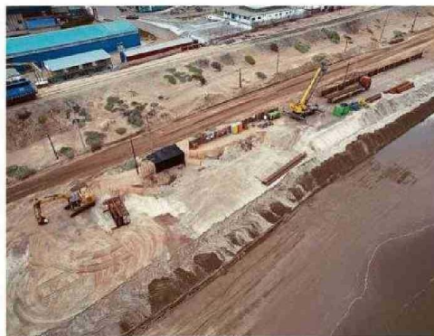
DESALINIZADORA DE AGUAS PACÍFICO EN QUINTERO-PUCHUNCAVÍ.

ra evaluar posibles sanciones, si es que se amerita según el caso”.