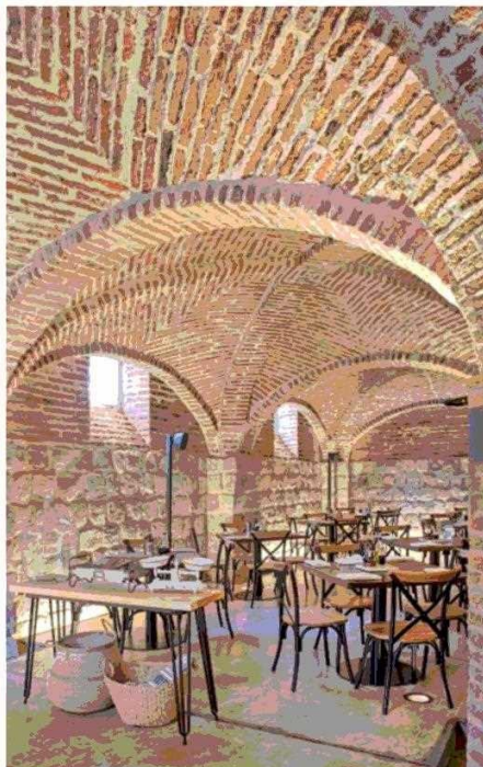
La iluminación incorporada da liviandad a la cava, realzando su forma y materialidad.

Este restorán y cafetería cuenta con tres accesos; el principal es por Lira esquina Alameda.