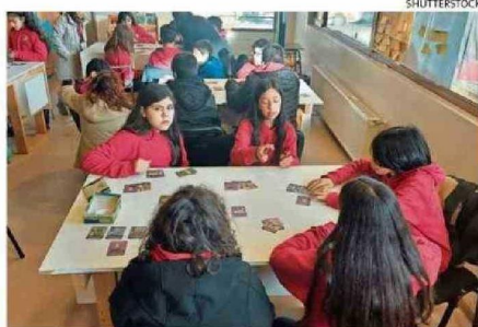
ALUMNOS DEL COLEGIO ALTAMIRA DE COYHAIQUE LO PROBARON.

ñada para dos a seis jugadores, en un circuito que dura entre a 20 a 35 minutos. Se proclama ganador el participante que primero logre reunir cuatro "colecciones".