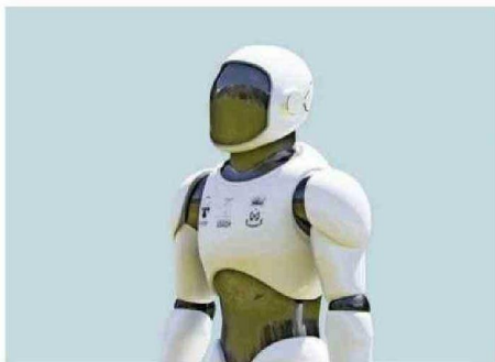
ASÍ LUCIRÁ EL ROBOT UNA VEZ TERMINADO. SE MOVERÁ CON RUEDAS.

Así comenzó un trabajo colaborativo con la FACH y que incluyó de inmediato a la Teletón, dada la idea de sus gestores de que el aparato fuera manejado por personas con discapacidad.