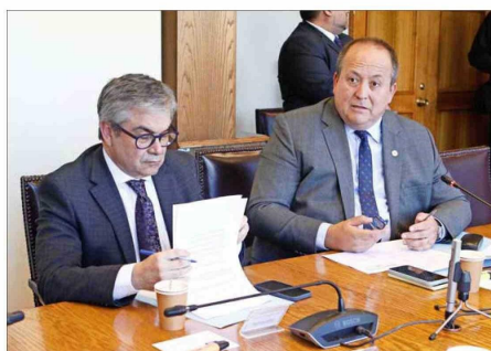
El ministro de Hacienda, Mario Marcel, se reunió ayer con el fiscal nacional, Ángel Valencia, en La Moneda, junto con el subsecretario del Interior, Luis Cordero, quien ofició de anfitrión del encuentro (foto archivo).

“Eso que la ministra llamó efecto 'rebote' tiene que ver con que en el presupuesto hay transferencias consolidables, que son recursos que salen de una institución, pero se van a otro servicio público”.