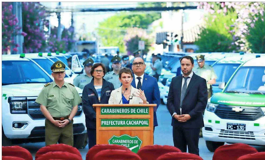
La titular de Interior, Carolina Tohá, entregó nuevos vehículos a Carabineros de San Vicente de Tagua Tagua ayer, un día después de que se hiciera público que el recorte presupuestario de su ministerio implicó una rebaja en el de la policía uniformada de más de $2.400 millones.

Como solución, Marcel explicó que "eso que la ministra llamó efecto 'rebote' tiene que ver con que en el presupuesto hay transferencias consolidables, que son recursos que salen de una institución, pero se van a otro servicio público para su ejecución. El propio Ministerio del Interior va a tener la oportunidad de decir, 'mire, el lugar de acá, en donde se están afectando recursos para