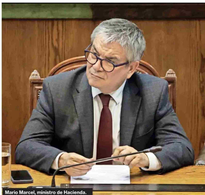
Mario Marcel, ministro de Hacienda.

ticaron que el FEES está exclusivamente para ser usado en casos de emergencia nacional, como sucedió en la pandemia del covid-19 o luego del terremoto grado 8.8 del 2010.