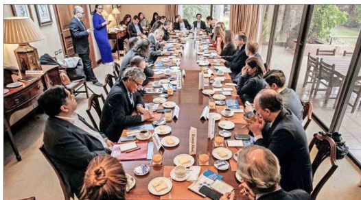
El Consejo Talento Futuro es una iniciativa de la ONG Generation Chile en alianza con Innovación de "El Mercurio", que reúne a representantes del mundo público, privado y académico.

nuevas tecnologías nos han permitido continuar mejorando la propuesta de valor entregada a nuestros clientes".