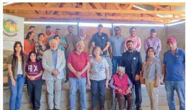
La Fundación Llampangü celebró este año dos décadas de existencia.