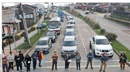
PROTESTAS.—Vecinos afectados por la situación se han manifestado en todo el país. En la foto, el sector Pedro de Valdivia, de Temuco.

Acota que con ello buscan pedirle a la empresa Enel que revise su forma de operar en los momentos de crisis y para que haya “una justa compensación” a los 60 mil hogares que se vieron afectados por el corte.