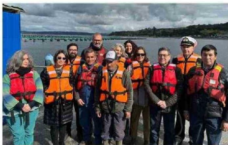
INSTITUCIONES QUE PARTICIPAN DE LA PARTIDA DEL ACUERDO.

AmiChile suma una segunda iniciativa en la línea de disminuir su impacto ambiental, comprometiéndose a intentar reducir el consumo de agua dulce y a la gestión y valorización de los residuos de la actividad concentrada en la zona.