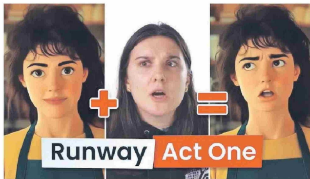
► El año pasado Runway lanzó Act One, un software que permite dar expresiones y movimientos humanos a los personajes generados por inteligencia artificial.