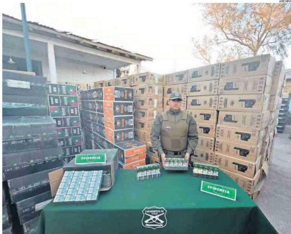
CARABINEROS BUSCA MEJORAR TRABAJO AL CRIMEN ORGANIZADO QUE INTERNA PRODUCTOS DE CONTRABANDO Y DROGAS AL PAÍS.