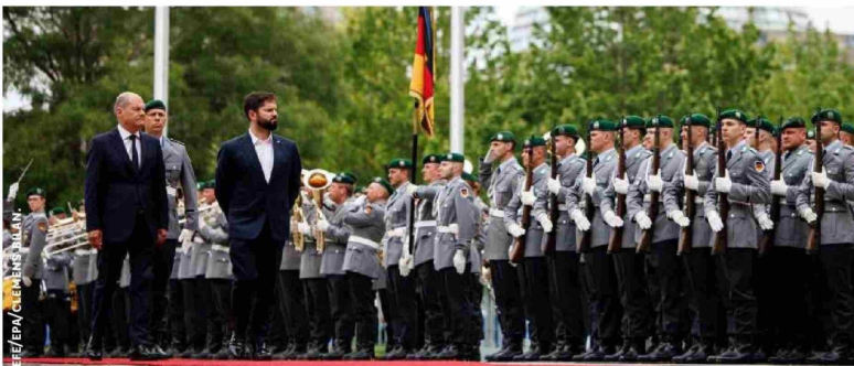
EL CANCELLER ALEMÁN OLAF SCHOLZ (L) camina junto al Presidente chileno Gabriel Boric durante una recepción con honores militares en la Cancillería de Berlín, Alemania, 10 de junio de 2024. El presidente de Chile se reunió con la canciller alemana para conversaciones bilaterales. (Alemania)

Scholz, por su parte, admitió que los resultados de este domingo para los tres partidos que conforman su coalición de Gobierno han sido "malos", aunque precisamente en este contexto es importante continuar con el trabajo para poder presentar "resultados" de cara a las próximas elecciones generales en 2025.