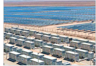
Los proyectos de almacenamiento van ganando terreno en los catastros de inversión.

No obstante, la cifra de intensidad de inversión para el año en curso sigue por debajo de 2023. En 2024 se contabilizan unos US$ 2.768 millones, un 39% me-