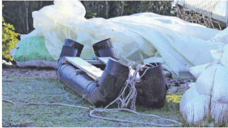
Virloche. Trineo fabricado con tuberías salmoneras en Ayacofa.

El año 2018, el experto inició un estudio sobre cómo los isleños de Chiloé enfrentaban esta basura aplicando sus antiguas costumbres, cuando antaño recurrían a materiales como la madera. Pero con el