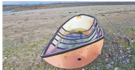
Embarcación auxiliar. Fabricada con restos de boya acuícola.