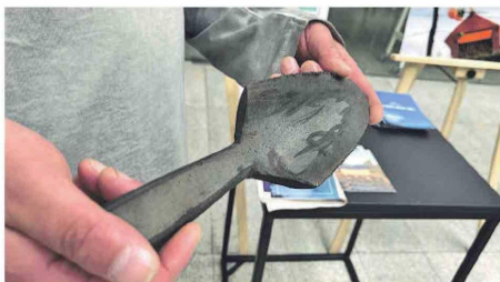
Pala. Hecha con un tubo de PVC.

—Sí, claro. Esta es una forma, porque nosotros lo hicimos parantes, pero también están los otros que son estacones... Entonces, se está utilizando más en este tipo de estructuras, que son los estacones, porque como te digo yo, le da una mayor durabilidad a través del tiempo. En relación a una estaca, el plástico tiene muchos años en que no se va a dañar.