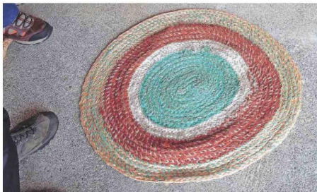
Choapino. Fabricado con nylon de origen pesquero artesanal.

tiempo se dieron cuenta que el plástico duraba más y fueron sustituyendo el material autóctono por los desechos.