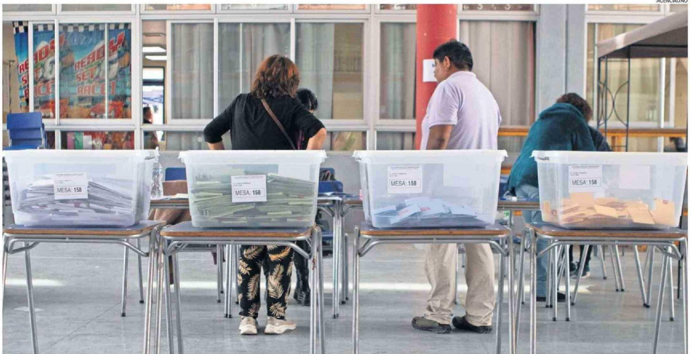
EN HORARIO DE LAS 11:30 AM SE CONSTITUYÓ EN LA REGIÓN EL 100% DE LAS MESAS. EMPLEADORES, DEBERÁN FACILITAR PERMISOS PARA QUE EL TRABAJADOR VOTE. POR OTRO LADO, HOY SERÁ FERIADO IRRENUNCIABLE.