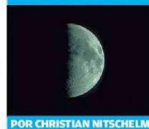
POR CHRISTIAN NITSCHELM

Mañana la Luna alcanza su fase Cuarto Creciente a las 20:56 (horario chileno legal de verano). Después de esta fecha y durante toda la semana, la fase de la Luna será gibosa creciente. Al nivel de los planetas del Sistema solar, podemos observar a Venus, resplandeciente dentro y después del crepúsculo. Este astro alcanzará su elongación máxima oriental el viernes 10 de enero y será después observable como un creciente más y más fino y extendido. Saturno y Neptuno se pueden observar durante las tres primeras horas y media de la noche (se debe observar a Neptuno con un telescopio potente y un excelente mapa). Urano es todavía observable durante más de la primera mitad de la noche (se debe utilizar un telescopio potente y un excelente mapa para identificar este astro), mientras tanto Júpiter permanece visible durante la mayor parte de la noche. Por su parte, el planeta Marte está ahora visible durante casi toda la noche. Mercurio se puede observar con más dificultad dentro de las luces del amanecer, solamente con la ayuda de binoculares potentes.